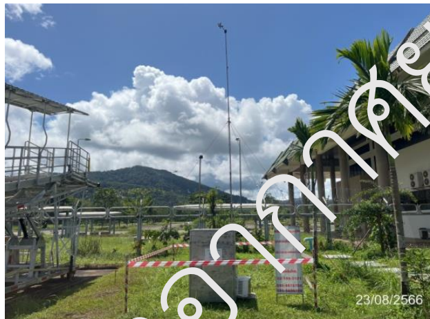
บริเวณอาคารท่าอากาศยาน

การตรวจวัดคุณภาพอากาศในบรรยากาศโดยทั่วไป