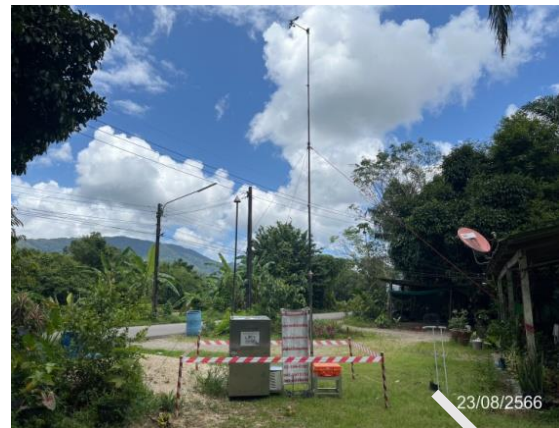
ชุมชนหมู่ที่ 2 บ้านล่าง