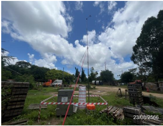
โรงเรียนบ้านละออง