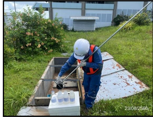
น้ำทิ้งหลังผ่านระบบบำบัดน้ำเสียของอาคารที่พักผู้โดยสาร